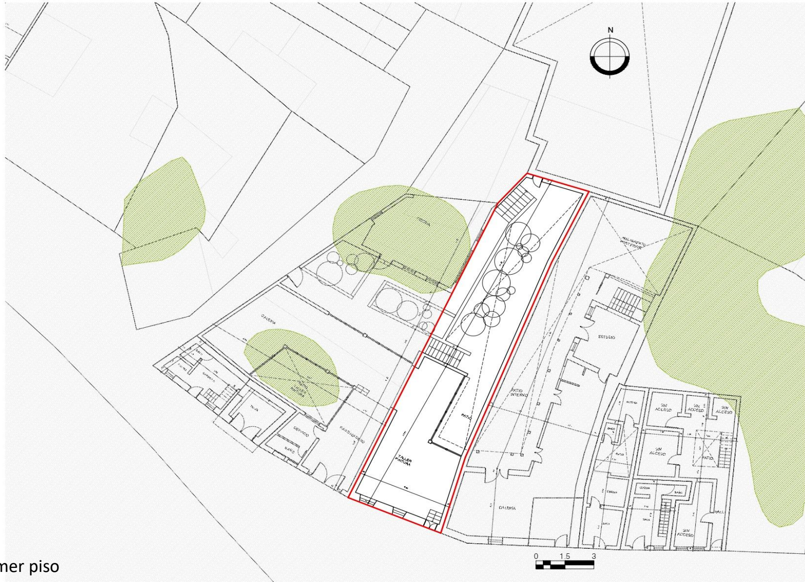
Planta primer piso